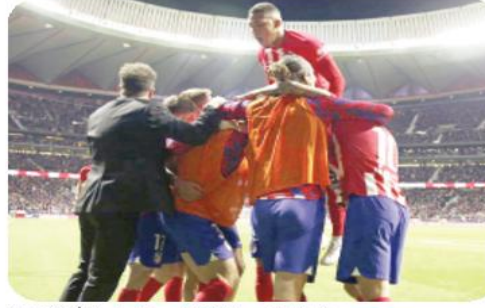
هيرابير الماضي، وبالتحديد في 19 من ذلك الشهر، عندما تغلب أتليكو مدريد على ضيفه ملعب سيغيتاس ميتروبوليتانو منذ شهر

نجح نادي أتليكو مدريد الإسباني، في تعظيم رقمه القياسي السابق بسابقة الدوري الإسباني الدرجة الأولى (لا ليجا) بعد هوزة الأحد على هياريال بنتيجة 3-1.