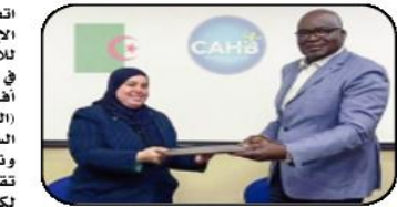
وقعت الاتحادية الجزائرية لكرة اليد، مع الكونفدرالية الإفريقية للعبة، أول أمس، على

اتفاقية يتم بموجبها تنظيم الجزائر لكأس السوبر الإفريقي (رجال وسيدات) والجولة الإفريقية للأندية الفائزة بالكؤوس في أبريل المقبل بـ وهران. في بيان نشرته الهيئة التي ترأسها كريمة طالب، أفيد أن "عملية التوقيع تمت على هامش بطولة (السوبر) ألعاب القامة حالياً بالملكة العربية السعودية". وتم بالمناسبة ضبط تواريخ اجراء المسابقتين، حيث تقرر تنظيم الطبعة الـ 13 لكأس السوبر الإفريقي لكرة اليد يومي 14 و15 أبريل 2024، على أن تقام بطولة إفريقيا الـ 40 للأندية الفائزة بالكؤوس من 18 إلى 27 أبريل من العام ذاته.