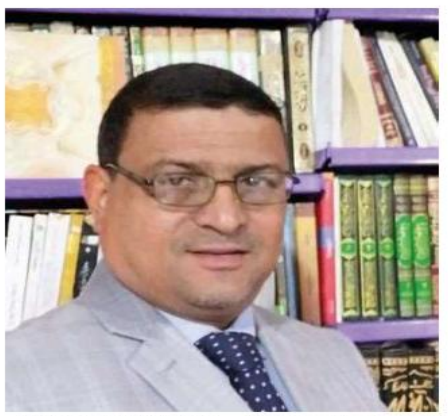
تولستوي دوستويشكي .

كشخصية تشكل النموذج الأكمل أخلاقيا واجتماعيا و انسانيا . ويرغم أن اولاد ثريا ابن عم رضوان . لكننا نجد سرديا يفتقر الحدث ليتحول جزء من هذه القضية ومقتا ح حلها . هذه الجنبية الانسانية المطروحة . محاكاة لتجرب اسم بالتشابه ومن سبقه الاب والجد) والذي يسعى جاهدا أن يكون جزءا نافعاً من مجتمعه . من هنا نرى أبا ( ثريا ) يسارع للاتصال به لمشاركته المشكلة والسعي في حلها . فعلا كانت مشاركته فاعلة من حيث الحراك في الجانب الطبي واصدار تقريراً طبييا يثبت بكارة ( ثريا ) او من خلال الاتصال بمحام متنرس لحل مشكلتها . يقول في نص صفت السارد وضع ابي ثريا وحديثه مع رضوان . وهو النموذج الذي يطالب الروائي باتخاذة قدوة اجتماعية لحياتنا المعيشة: ( ... انشغلنا بتعب ( ثريا ) وحالتها النفسية المتردية ... كل هذا وأنا افكر بحل لأبيات عدم الدخول بها . الكلام بدأ يثار عن سبب وجودها عندنا ... لم يخطر ببالى الا انت كل شيء تغير منة حولنا . لم تعد قريتنا . واجزم ان كل القرى تتشابه في هذا . لم يعد هنالك من أزمان الأباء والأجداد إلا التذمر اليسير . كنا دوما أسرة واحدة الألام والووجع بمعناها ... كنا نسابق لستر