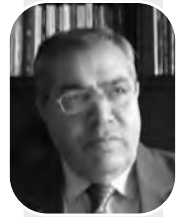
شعر: فهران الخطيب