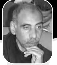
بقلم: علي شكتك

المستوطنين فوق أرضهم، وإنه بدون الخوذات الفولاذية وفوهات المدافع لن نكون قادرين على غرس شجرة أو بناء منزل، علينا ألا ننخدع بمظاهر الاشمزاز البادية عليهم والتي تصيغ حياة مئات الآلاف من العرب الذين يعيشون حولنا، إن علينا ألا نغفل لحظة عنهم لتلا توهن أسلحتنا، إنها قضية مصير جيلنا، أن هذا هو خيار حياتنا، أن نكون مستعدين ومسلحين، قساة وخشنين عبيدين وإلا انتلم السيف في قبضاتنا وقضي علينا".