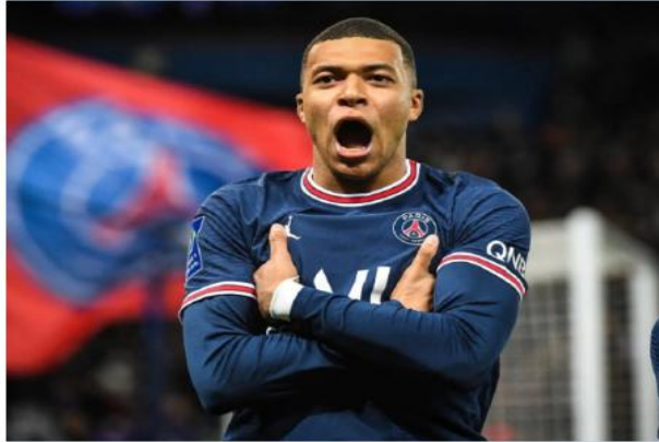
يتذكر الرئيس فلورنتينو بيريز تعامل نادي باريس سان جيرمان مع

ولوقف مبابي دور في نشر الإعلان الأخير، إذ لم يتأكد ريال مدريد حتى الآن من رغبة نهائية للمهاجم الفرنسي بالرحيل عن باريس سان جيرمان نحو النادي "الملكي" بداية من الموسم المقبل، وهذه المعطيات أمست تشكل ضغطاً على الرئيس فلورنتينو بيريز الذي سيواصل العمل خلف الكواليس ويعدنا عن الأوضاع لتحقيق حلمه بضم نجم عالمي آخر.