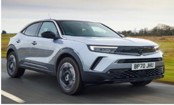
تحتل «أودي A3» (المركز العاشر) في القائمة بعدد 25,452 سيارة مبيعة في السوق البريطاني خلال 2023. وهي قرينة «أويل موكا» في مصر- حيث بلغت مبيعاتها 25,473 سيارة، وأخيرًا

القوة المتوقعة بين البترين والديزل والكهربائية، ومن المنتظر وصول نسخة فيس ليفت لاحقاً هذا العام.