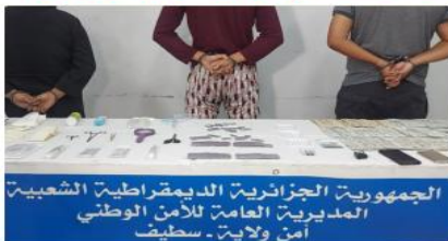
الجمهورية الجزائرية الديمقراطية الشعبية المدنيّة العامّة للأمن الوطني أمير ولاية سطيف

تمكنت فرقة مكافحة الجريمة السيبرانية بسطيف من تفكيك شبكة وطنية تشكلت من 03 أفراد على رأسهم امرأة تتراوح أعمارهم بين 26 و45 سنة تنشط في مجال ترويج حبوب الإجهاض. التحقيقات في القضية أطرته فرقة مكافحة الجريمة المعلوماتية والتي رصدت تعاملات مشبوهة عبر مواقع التواصل الاجتماعي وبالتحديد عبر صفحات ومجموعات مغلقة في فيسبوك تنشط في مجال ترويج حبوب الإجهاض. التحري المعمق والتتبع للصفحات والمجموعات المشبوهة مكّن من تحديد هوية المشتبه فيه الأول الذي تبين أنه ينحدر من إحدى الولايات الساحلية الشرقية، حيث ضبطت مكنا بمدينة سطيف بحوزته كمية أولية من حبوب الإجهاض قدرت بـ 09 أقراص مهيأة للترويج إلى جانب 03 هواتف نقالة مرتبطة بحسابات عبر صفحات التواصل الاجتماعي ليتم تحويله إلى التحقيق الذي كشف أنه يقوم باستغلال مواقع