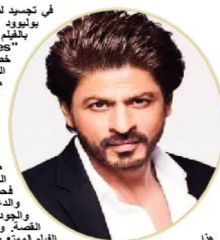
هذا خدفة "نتفليكس": "موضوع

في تجسيد لمشاعر الأبوة الفخورة، عبر نجم بوليوود شاروخان عن إعجابه الشديد بالفيلم الجديد لابنته سوهانا خان؛ "The Archies"، والذي يمثل أولى خطواتها في عالم الفن والسينما، الفيلم، الذي يعكس الوعي البيئي ويحكي قصة مجموعة من المراهقين ومحبتهم لأحيائهم الخضراء، ومن إخراج زويا أختار، يعرض موابه شابة وإعاده أ جذب سوهانا خان، مثل خوشي كابور وأغاسنيا تاندا، حفيد أميتاب باتشان. شاروخان، في تعليقه على الإعلان الترويجي للفيلم الذي شاركه على موقع التواصل الاجتماعي إنستغرام، الخصب به، لم يكف بمشاركة الإعلان فحسب، بل كتب رسالة مليئة بالحب والدعم، متنيا على الرؤية الفنية لزويا أختار والجودة البريئة والنقية التي تحملها هذه القصة. وقد تمنى لفريق العمل كل التوفيق في الفيلم الممتع والذي يحمل رسالة معنوية قوية. وكتب معاصر "موضوع