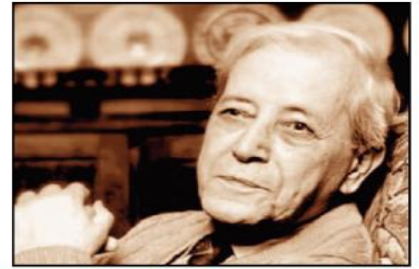
مساهمة: بوداود عمير