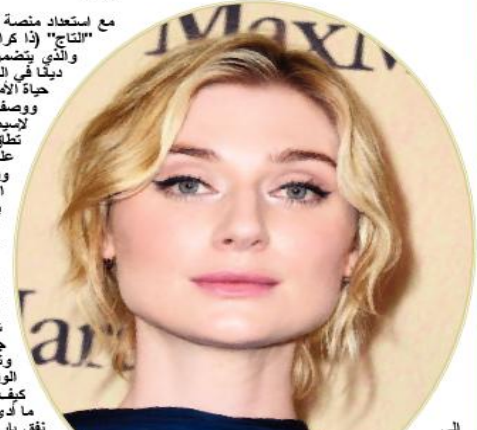
إلى ولم دومينيك من "ذا المشاهد الثقيلة ديانا، وإخبار إبنيه ويذا ويست تصوير شخصية الأمير تشارلز في الموسم الخامس، الذي ركز على فسخ زواج الملك المستقبلي من ديانا، واستمر في تجسيد دور تشارلز بالموسم السادس. وبينما يرض الجزء الأول من الموسم السادس من مسلسل "التاج" واحدة من أملك اللحظات في التاريخ الملكي، قالت ديبيكي إنها تتق بالمبدع بيتر مورغان، و"المخطط العاطفي" الذي وضعه، حيث وضع حدث السيارة جنيا إلى جنب مع "الفرح الحقيقي والسعادة والخفة والعاطفة"، ليقدم متعة حقيقية على الشاشة، في بداية الموسم.

مع استعداد منصة نتفليكس العالمية لعرض الجزء الأول من الموسم الأخير من مسلسل "التاج" (ذا كراون)، المستوحى من حياة العلة الملكية البريطانية، الأسبوع لعقيل، والذي يتضمن وفاة الأميرة ديانا، كشفت التجمة الزيليث بيبيكي، التي تجسد دور ديانا في المسلسل، أن إعادة تمثيل بعض المشاهد المتطفة باللحظات الأخيرة من حياة الأميرة كانت "صعبة جدا".