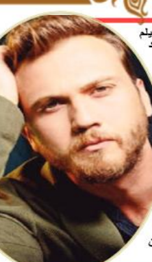
قبل أيام عرض فيلم "أتاتورك" بمناسبة العيد الوطني لتركيا، وهو بطولة أراس بولوت إينملي بطل "الحفرة" والذي غاب سنوات عن جمهوره لارتباطه بهذا العمل، ولكن عرض الفيلم خيب آمال جمهوره.

بعد عرض فيلم "أتاتورك" بمناسبة العيد الوطني لتركيا، وهو بطولة أراس بولوت إينملي بطل "الحفرة" والذي غاب سنوات عن جمهوره لارتباطه بهذا العمل، ولكن عرض الفيلم خيب آمال جمهوره. عرض فيلم "أتاتورك" عبر قناة "فوكس" التركية، طالب جمهور أراس بولوت بعرض الفيلم عبر شاشة إيدي المنصات الرقمية بسبب استغلال قناة فوكس للفيلم وكثرة الإعلانات، وقد تواجد أراس بولوت "أتاتورك" قبل ساعات في هوليوود لحضور فعاليات مهرجان الدراما التركية هناك وحضور العرض العالمي الأول للفيلم وسط الجمهور. وفقر انتهاء العرض هناك صدقاؤه المتواجدون بالمهرجان ومنهم أنجين التان بطل "أرطغرل" ومريم أوزرلي بطلة حريم السلطان. أما إسرائ بيلجينتش، بطلة أتاتورك فقد نشرت الموقع التركية الإلكترونية أنها تعرضت لموقف محرج أثناء تواجدها بحفل المؤتمر الصحفي بالعرض الخاص للفيلم بتركيا إذ تمزق فستانها أثناء تواجدها بالعرض. ويشترك في بطولة الفيلم نور سونغول التي ظهرت لأول مرة بدت فني منذ إعلان خبر حملها قبل شهر.