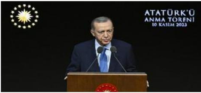
ويغض قسم مهم من دول وحكومات العالم بحسب الرئيس التركي أعينها عن الظلم الواقع على الفلسطينيين