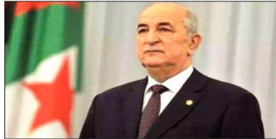
الجمهورية، السيد عبد المجيد تبون، اليوم الخميس 25 ربيع الثاني 1445 هجري الموافق 09 نوفمبر

2023 ميلادي، حركة واسعة في سلك الأمانة العامة بالولايات» وقد شملت هذه الحركة يضيف نفس المصدر «ترقية خمسة عشر (15) إطارا محليا من سلك المفتشين العامين بالولايات ومدراء الإدارة المحلية والسقيين والشؤون العامة وروساء الدوائر لشغل وظيفة أسماء بالولايات» كما شملت أيضا «تحويل سبعة (07) أسماء عامين نحو ولايات أخرى وإنهاء مهام ستة (06) أسماء عامين بالولايات» وتهدف هذه الحركة التي تأتي عقب تلك التي أجراها رئيس الجمهورية في سلك الولاة والولاة المتدربين، إلى «تعزيز وتيرة التسمية المحلية وضمان التنجيد الصارم للقرارات المتخذة بشأنها، لا سيما من خلال التأطير الناجع للشؤون المحلية من طرف إطارات مؤهلة وذات كفاءة»، وفقا لما تضمنته ذات البيان.