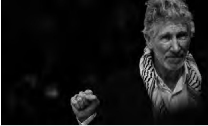
فعلي الأول هو انتظار الأمور ورؤية ما ستؤول إليه الأمور. أما رد فعلي

الثاني، فقد تعجبت كيف لم يتوقع الإسرائيليون ما حدث. وواصل ووترز تعليقه قائلاً: هل لم يسمع الجيش الإسرائيلي الانفجارات في جميع القواعد عندما فجروا كل شيء من أجل العبور؟ هناك شيء غريب في هذا الأمر. وعندما سُئل عما إذا كان يبرر الهجوم الذي نفذته حماس، أجاب ووترز بقوله: نعم، المقاومة حقاً وفقاً لاتفاقية جنيف. إنهم ملزمون قانونياً وأخلاقياً بمقاومة الاحتلال منذ عام 1967س. ق٣