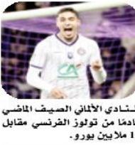
النادي الألماني الصيف الماضي قادما من تولوز الفرنسي مقابل 10 ملايين يورو.

تأهل المنتخب الجزائري رجال حسب الفرق إلى الدور النهائي للبطولة الإفريقية الثالثة عشرة للرابطة للقوس والسهم المؤهلة للألعاب الأولمبية باريس 2024 والتي تتواصل إلى غاية 12 نوفمبر الجاري بمدينة نابل التونسية بمشاركة 94 متنافسا يمثلون 20 بلدا إفريقيا. وفاز المنتخب الجزائري على نظيره المصري بنتيجة 5 مقابل 4 حيث سبلاقي في الدور النهائي نظيره المصري. من جهته لم ينجح المنتخب الجزائري للسيدات في تجاوز الدور ربع النهائي حيث أفضى من قبل نظيره الايفوارى. وتشمل المنافسات اختصاصين اثنين وهما القوس الأولمبي للرابطة للألعاب الأولمبية وكذا القوس المركب على مسافة 50 مترا الذي سيتنافس فيه الرماة للفوز بالبطولة الإفريقية. وتشهد البطولة الإفريقية كذلك مشاركة رايمين اثنين من الجزائر والسنغال في منافسات الألعاب البارالمبية. ويتأهل المتحصلين على الميداليتين الذهبية والفضية للألعاب الأولمبية شريطة أن يكونا قد حققا الرقم الأدنى الأولمبي المقدر ب640 نقطة في هذه البطولة أو في دورات سابقة مسجلة لدى الاتحاد الدولي للرابطة.