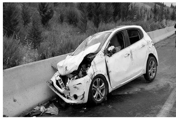
07 الى 08 نوفمبر 2023 سجلت وحدات الحماية المدنية 2729 (أي تدخل كل 31 ثانية)، منها 1985 إجماع صحي و

445 عملية مختلفة، عبر مناطق مختلفة من الوطن وهذا على إثر تلقي مكالمات الاستغاثة من طرف المواطنين، هذه التدخلات شملت مختلف مجالات أنشطة الحماية المدنية سواء المتعلقة بحوادث المرور، الحوادث المنزلية الإجماع الصحي، إخماد الحرائق و كذا الأجهزة الأمنية. الى جانب هذا، تدخلت مصالح الحماية المدنية لولاية تيسمسيلت من أجل نقل 02 ضحيتان تبلغان من العمر 33