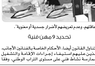
إعاقهم، وعدم تعريضهم لأضرار جسدية أو معنوية.