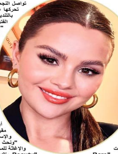
الغنية: سيلينا غوميز

المساعدات شركة "Rare Beauty" جمعية ماجن ديفيد آدم، وجمعية الهلال الأحمر الفلسطيني في توفير الإغاثة للمساعدة في الشمولية، شركتنا متجذرة في الشمولية، شركتنا متنوعة وتوظف أفرادا من خلفيات مختلفة بما في ذلك العرق والعقيدة والجنس والهوية الجنسية والدين - وقد تأثر الكثير منهم بشكل مباشر بأحداث العنف الأخيرة، ونحن ندرک أيضا أن مجتمعنا يتكون من العديد من الأشخاص من خلفيات مختلفة والذين تأثروا جميعا بأحداث العنف الأخيرة، لذلك نطلب من الجميع أن يعملوا بعضهم البعض بلطف ورحمة خلال هذه الأوقات".