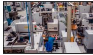
الإفلاس في الشهور المقبلة.

يأتي ذلك في وقت قل فيه مكتب الإحصاءات الاتحادية الألماني أسس إن الإنتاج الصناعي في البلاد لخفض بأكثر من المتوقع في سبتمبر بنسبة 1.4 في المئة، مقارنة بشهر السابق.