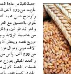
باشرت تعاونية الحبوب والبقول الحاملة لولاية البيض، عملية توزيع