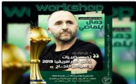
جامعين و تسليح هذه المبادرة في إطار النشاطات الجوارية للمدرّب الوطني.

جوانب متعلقة بالعمل اليدي (تقني، تكتيكي، بدني، ذهني، تسيير وتنظيم)، كما اشارت القاف. و يأتي هذا الموعد، أياما قبل التجمع الاعيادي المقبل «للخضر» المقرر ابتداء من يوم الاثنين 13 نوفمبر بالمرکز الفني الوطني بسبدي موسى، تحسبا للمبارتين التصفيين الأولين لكأس العالم الذي ستقام نهائياته بالولايات المتحدة الأمريكية، كندا والمكسيك. و يستهل زملاء القائد ورئيسا محرز «الأهلي» السعودي الصفحات باستقبال منتخب الصومال يوم الخميس 16 نوفمبر 2023 بملعب نيلسون مانديلا برالي بالجزائر العاصمة (18,000 س)، قبل التوجه إلى مابوتو لواجهة للموسم يوم الاحد 19 نوفمبر بملعب زامبيو (14,000 س).