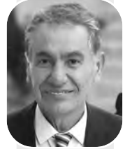
بقلم: جلال نشوان

المقدسي يقوم بهدم بيته بمعوله؟ وإذا لم يفعل ذلك، تأتي البلدوزرات بهدمه، ويتم تغييمه آلاف الشواكل