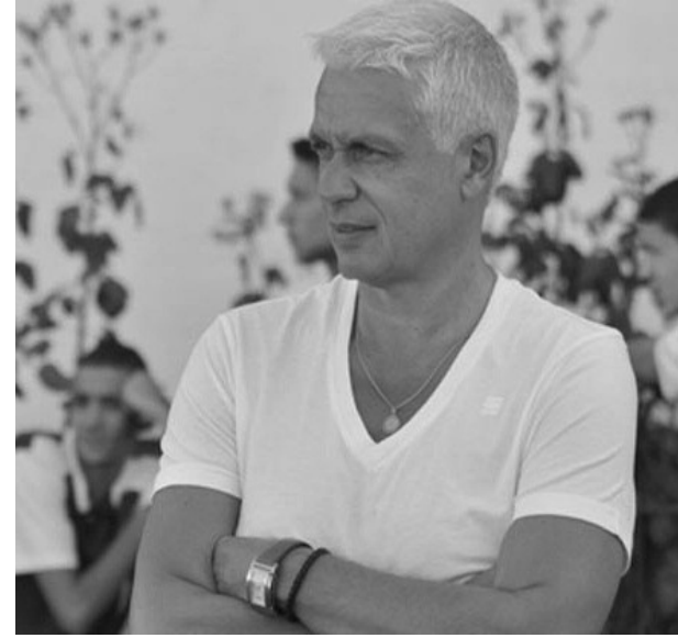
فيلود - الذي تولى المسؤولية عام 2022 - في تصريحات (Match) عن منافسة الجزائر

يعتبر مهاجم نادي غانغان الفرنسي، أمين الوزاني، من اللاعبين المتألقين في بطولة الدوري الفرنسي في درجته الثانية فصاحب الـ 22 سنة، المنحدر من أب مغربي وأم جزائرية، تطور مستواه الفني والبدني في الآونة الأخيرة، ليصبح واحداً من اللاعبين الذين يتابعهم مدرب منتخب "أسود الأطلس" وليد الكراكي، بعدما سبق له قيادة المنتخب المغربي تحت 23 سنة، للتأهل إلى أولمبياد باريس 2024. وفي ظل الجدل الذي انتشر مؤخراً في المغرب، حول إمكانية عدول المهاجم، أمين الوزاني، واختياره للعب للمنتخب الجزائري الأول، على حساب المنتخب المغربي، مثلما فعل قبله نجم ميلان الحالي، إسماعيل بن ناصر، المنحدر كذلك من أب مغربي وأم جزائرية، وضع اللاعب الوزاني حداً لكل الأقاويل، بعدما وجه رسالة إلى مسؤولي الاتحاد المغربي لكرة القدم، أخبرهم من خلالها بأنه يريد مواصلة مشواره مع المنتخب المغربي. وفي هذا الإطار حصل "العربي الجديد" أمس، على معلومات من مقرب من اللاعب، أمين الوزاني، أكد من خلالها أن مسؤولاً من الاتحاد الجزائري لكرة القدم، عرض عليه قبل أشهر إمكانية الانضمام لصفوف المنتخب الجزائري، قبل أن يخبره اللاعب بأنه يركز على مسيرته مع المنتخب المغربي الأولمبي، ويطمح لدخول تشكيلة منتخب "أسود الأطلس". يُذكر أن أمين الوزاني، قد لفت الأنظار مع نادي غرونوبل الفرنسي بفترة تحت 19 سنة، قبل أن ينضم لنادي بورغ أون بريس الفرنسي، وبعده التحق بصفوف غانغان الفرنسي الذي يتألق معه لحد اللحظة بشكل واضح.