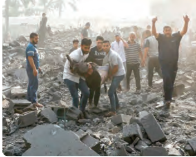
الدمار الصهيوني، مقترحة "ضرورة" تفعيل كل وسائل التجنيد والدعم والتعبئة، وعلى رأسها وسائل للشعب الفلسطيني في مواجهة آلة

وبالنظر إلى أن القضية الفلسطينية اليوم تحتاج إلى إجراءات عملية على المستويات السياسية والقضائية والقانونية، ناشدت الأحزاب بضرورة دعوة الأمم المتحدة للتنسيق مع الدول الداعمة للحق الفلسطيني، لتحقيق النصاب المطلوب في اتخاذ موقف دولي لتجريم الكيان الصهيوني.