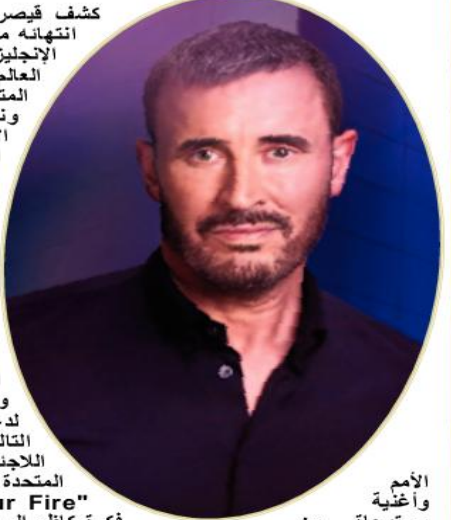
الأمم وأغنية مستوحاة من

الأمم المتحدة للطفولة)، برنامج الأغذية العالمي". اليونيسيف (منظمة "Hold Your Fire" تلحن كاظم الساهر، كلمات توم لو، فكرة كاظم الساهر، وتوزيع ميشال فاضل، بالتعاون مع جمعية الأمم