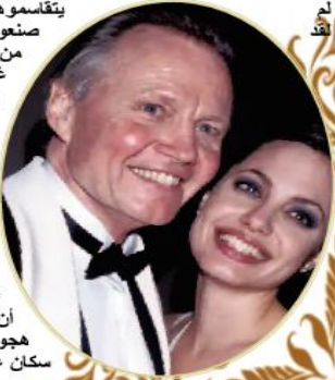
قالته الفنانة المصرية وفاء عامر عن مسلسل "أولاد الحاج متولي"

وقد كانت أنجلينا جولي قد تحدثت على أحداث غزة مرتين، في المرة الأولى ضربات حماس على غزة مشيرة إلى أن هذا لا يبرر هجوم إسرائيل على سكان غزة الأبرياء.