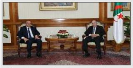
استقبل رئيس الجمهورية، السيد عبد المجيد تبون أمس رئيس حركة مجتمع السلم، السيد عبد العالي حساني، وذلك بطلب منه، حسب ما أفاد به بيان لرئاسة الجمهورية.