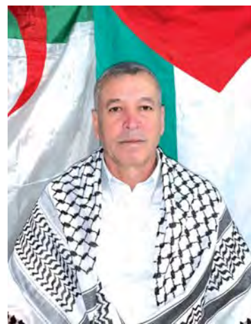
بقلم: أ. إيمورت بن براهيم

ومناطق عدة في المعمورة، إلا برهان على انسلاخهم جيلا بعد جيل من أمتيتهم، واكتسابهم بشكل نهائي للمناعة من فيروس معد اسمه الإنسانية، والحمد لله، أن ضمائر شعوب كثيرة بالقارات الخمس لا تزال تعاني منه، فضلا عن عدد قليل جدا من السامسة عبر العالم، ما زالوا يحملون بالفطرة أعراض هذا الداء العُضال بنسب متفاوتة، .. فالأكيد أن تعالي أصوات الشعوب هنا وهناك، تعاطفا مع آتات وآهات أهالي الشهداء والجرحى بغيره، قد لا تعلق على أصوات القصف المدوية حاليًا، ولكنها تمثل جرعات مواساة مسكئة للمكرومين، تخفف من وطأة مصيبتهم، وتلهمهم صبرًا جميلًا يقارعون به مصاعب حياتهم المستجدة، ولا شك أن مثل هذه الزفريات الإنسانية للشعوب، لاسيما من لُكن طبقات المفكرين والأدباء و المثقفين ونجوم الفن والرياضة، ستشعر أهالي عزة بدفع مشاعر العائلة الكونية، وتفتح نفوسهم المنكوبة المنكسرة على أمل معاودة فعل الحياة، وأن تصاعد وتيرة الصرخات المستنكرة للعدوان، لكيفية باسكات ذوي المدافع، واستكانة المجرمين الديمويين خوفًا من طوفان الشعوب الغاضبة الثائرة ..