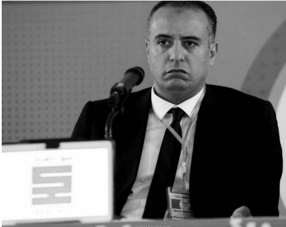
الرقي بكرة القدم الوطنية على جميع المستويات.

اختتم رئيس الاتحاد الجزائري لكرة القدم، وليد صادي، سلسلة اللقاءات التي عقدها مع مختلف الرابطات الولائية، الاثنين بالمركز الفتي الوطني بسيدي موسى (الجزائر) حيث اجتمع برؤساء الرابطات الولائية، لولايات الجنوب والوسط، حسب ما افادت به الهيئة الكروية. وكشفت الموقع الرسمي للطاقم، بأن هذه الخطوة تأتي استكمالاً للجلسات السابقة التي عقدها صادي، في وقت سابق، مع مختلف رؤساء الرابطات الولائية.