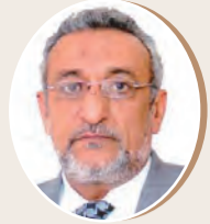
بقلم: منصور الزنداني ص 9