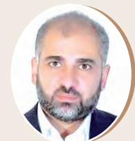
بقلم: مصطفى يوسف اللداوي ص 10

الهمر الإلزامي لحرية الأسرى الإسرائيليين