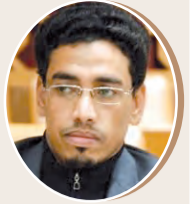
بقلم: حسن حمورو ص 9