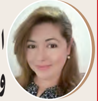
بقلم: أميرة زاتير ص 8

الهمر الإلزامي لحرية الأسرى الإسرائيليين