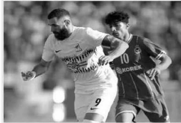
مؤقا برصيد 7 نقاط، وكنت مباراة الذهاب نظيف حمل توقيع المغربي عبد الرزاق حمد بين الفريقين قد انتهت بفوز اتحاد جدة بهدف