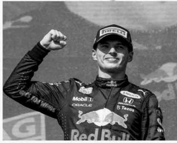
1، ما جعله يواصل تحقيق الأرقام القياسية في هذه الرياضة. وحقق الهولندي ماكس فيرستابن سائق فريق ريد بول المركز الأول في سباق جائزة البرازيل الكبرى، فيما جاء

لاندو نوريس سائق فريق ماكلارين ثانيا، في حين استطاع الإسباني المخضرم فرناندو ألونسو سائق فريق أستون مارتن تحقيق المركز الثالث، والصعود للمرتبة الثامنة إلى منصة التتويج في عام 2023. وشهدت سيارة شارل لوكليوك سائق فريق فيراري في لفة التحمية خلال سباق الجائزة الكبرى في البرازيل، وكان الجناح الأمامي قد كسر بالفعل، ما جعل السائق يبلغ فريقه بأنه خسر نظام الهيدروليك في سيارته. وكان فيرستابن، قد حاز مركزه الأول في الترتيب العام بالحصول على نقاط سباق "سبرينت" الذي أقيم السبت، فرغم أنه لم يتطرق من المركز الأول، بل من خلف لاندو نوريس من فريق ماكلارين، فإن الهولندي تجاوزه في أول منعرج وسيطر على السباق ولم يترك لمنافسيه أي فرصة لمحاولة العودة. وتقدم فيرستابن على لاندو نوريس الذي حل ثانيا، في وقت صاد فيه المركز الثالث إلى المكسيكي سيرجيو بيريز. ويسيطر السائق الهولندي على بطولة العالم التي حسمها منذ جولة قطر على حلبة لوسيل، وقد حقق هذا الموسم 17 انتصارا، وهو رقم قياسي عالمي بعد أن كان الرقم السابق ملكه أيضا، إلا أن فيرستابن يريد دعم هذا الرقم ليتفادى تحطيمه في الموسم القريب القادمة. ويضمن البقاء في سجل بطولة العالم سنوات إضافية.