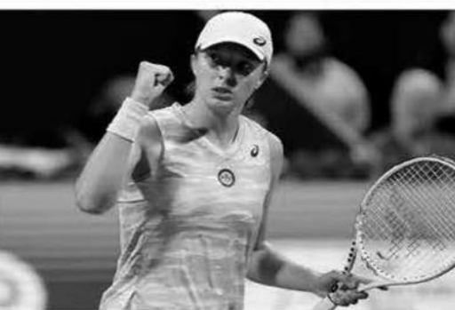
مترعبة على عرش صدارة التصنيف العالمي للسيدات "WTA".

أطاحت البولندية إريغا شفيونتيك بالمصنفة الأولى عالميا البيلا روسية أريغا سابالينكا من الدور نصف النهائي للبطولة الختامية للألعاب التنس، المقامة حاليا في مدينة كاتكون المكسيكية. وتمكنت إريغا شفيونتيك، المصنفة الثانية عالميا، من الفوز بسهولة على النجمة أريغا سابالينكا بمجموعتين متتاليتين، بنتيجة: (6-3) و(6-2) في المباراة التي جمعتها فجر اليوم الإثنين، واستغرقت ساعة واحدة و37 دقيقة. وضربت أيضا شفيونتيك موعدا في نهائي البطولة الختامية للألعاب التنس المحترفات "WTA Finals Cancun" البالغ مجموع جوائزها 9 ملايين دولار، مع اللاعبة الأمريكية جيسكا بيفولا، المصنفة الخامسة عالميا، التي تغلبت بدورها على مواطنتها كوكو جوف، المصنفة ثالثة، بمجموعتين من دون رده أيضا، بواقع: (6-2) و(6-1). وستستفيد إريغا شفيونتيك (22 عاما) المركز الأول في التصنيف العالمي للألعاب التنس