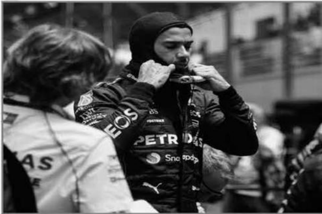
إلى تبقى موسمين في عقده. وواصلت أن توتو وولف مدير فريق مرسيدس من يتحمل تراجع أداء هاميلتون في الموسم الحالي على وجه الخصوص، لأنه يقيم في مونكو وبعيد عن ما يجري خلف الكواليس، حيث يتسبب تاريخ فورمولا 1 إلى أن المسؤول عن الفريق، يجب أن يكون أول

من بدأ الدوام اليومي وأخر من يخرج منه. واستمرت أن هاميلتون استطاع احتلال المركز الثامن في سباق جائزة البرازيل الكبرى، بفارق دقيقة و3 ثوان فقط عن صاحب المرتبة التاسعة، فيما عانى زميله في الفريق جورج راسل مع سيارته، بسبب ارتفاع درجة حرارة الزيت، ووجود عطل في المحرك. وأكدت الصحيفة على أن هاميلتون يدرك جيدا، بأنه أخطأ في الموافقة على الاستمرار مع فريق مرسيدس، وعدم الانتقال إلى فريق جديد في الموسم القادم، لأن استمرار الإدارة الحالية في الاستثمار بنفس السيارة، يدل على صعوبة منافسة فريق "ريد بول" وسائقه الهولندي الملتزم ماكس فيرستابن. واختتمت بالإشارة إلى أن لويس هاميلتون لا يعيش أسوأ أيامه في فورمولا 1 فقط، بل أيضا هناك حالة من الفوضى تضرب تنظيم طرفة العمل في فريق مرسيدس، حيث طالب في أكثر من مناسبة خلال سباق جائزة البرازيل الكبرى، بتغيير الإطارات، لكنهم طالبوا منه الاستمرار والمنافسة، وهو يدرك عدم قدرته على تحقيق شيء. يتذكر أن النجم البريطاني المخضرم، لويس هاميلتون، سائق فريق مرسيدس رفض إعلان انتهاء مسيرته في الموسم الحالي، بعدما استطاعت إدارة فريق مرسيدس بتجنيد عدة، لمدة موسمين إضافيين، حتى يتمكن من تحقيق حلمه، وهو تحقيق لقب بطولة العالم للمرة الثامنة، وتحطيم رقم الأسطورة مايكل شوماخر (لديه 7 ألقاب).