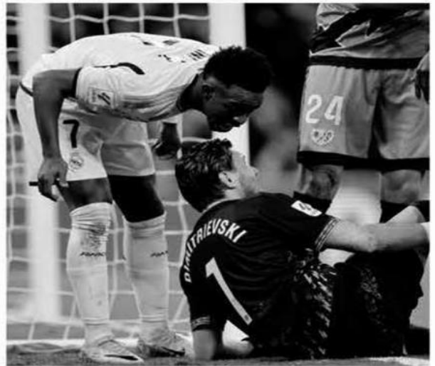
فقد النجم البرازيلي، فينيسيوس جونيور، أعصابه خلال مباراة الدوري الإسباني أمام نادي رايو فايكانو بعدما فشل في التلقين لملصحة فريق جيرونا.

وأظهر برنامج "راديو إستانديو نوثي" الإسباني، مساء الأحد، صور غضب فينيسيوس وتوجيه كلمات تهديد واضحة للحارس، ستولي ديميتريفسكي، في إحدى اللقطات، إذ قال له: "سأنتقي أنا وأنت في الخارج، سنلتقي خارجا". وفسر المتابعون أن فينيسيوس جونيور هو لاعب مستفز ويثير أعصاب المنافسين وحتى الجماهير، وهذا ما يعرضه في بعض المرات لتصرفات عنصرية واعتداءات من بعض اللاعبين. لكن الحارس المقدوني رفض تصخيم الحادثة بعد نهاية المباراة، لذلك أدلى بتصريحات من شأنها أن تخفف الانتقادات ضد فينيسيوس، إذ صرح: "لو التفتيت فيني في الخارج كنت سأعاقبه، فيما يفعله داخل الملعب اعتبره تصرفا طبيعيا". ومنذ تعرضه لاعتداءات عنصرية وقيادته حملات لإيقاف هذه التجاوزات، أصبح النجم البرازيلي أمام موجة من الانتقادات، إذ أمسى هدفا سهلا في كل مرة يقع خلالها في الخطأ في حين يعيش ضغوطا كثيرة على أرض الملعب. ولا شك أن الحوادث العنصرية التي يتعرض لها فينيسيوس أثرت على أدائه بشكل واضح، إذ تراجع دوره ولم يعد يقدم الإضافة الكافية المنتظرة منه، في حين لا يزال المدرب الإيطالي، كارلو أنشيلوتي، ينتظر منه الكثير.