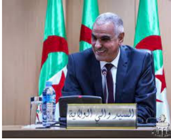
مهدي - ل

الوطنيين رقم 05 و45، 300 هكتار ضمن مخطط وإدراجها ضمن التوسعة التوجيهي العمراني لمختلف المشاريع والعمل على توفير العقار المناسب الذي سيسمح بمنح برنامج سكني مكثف من قبل الوزارة الوصية وتستفيد منه الولاية في غرس مختلف المشاريع المستقبلية كما دعا الاجتماع إلى ضرورة تصحيح المغالطة الشائعة لدى الرأي العام بأنجاز سكنات فوق أراضي فلاحية وتسويتها فيما بعد، بحكم مخالفة القوانين التي لا تسمح بمراجعة تسويتها وتحديد المناطق المنسوبة لتشديد البنائيات وإدراج العقارات الحضرية لمنطقة عوين زريقة 105 هكتار ضمن مخططات شغل الأراضي مع دعوة وإلزام أصحاب البنائيات الخاصة المحاذية للطريق الوطني رقم 05 بتحسين وتسوية واجهات بنائياتهم مع إمكانية إضافة طوابق علوية لإعطاء الوجه اللائق للمدينة العصرية