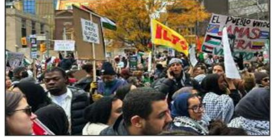
أصل الماصرون للقضية الفلسطينية في مدن كندية مختلفة للاحتشاد، للأسبوع الرابع على التوالي لدعم فلسطين والمطالبة بوقف العدوان الصهيوني من مدنيين بالصلست الدولي إزاء الجرائم الصهيونية المستمرة بحق المدنيين والأطفال في غزة. وخرج عشرات الآلاف في وسط مدينة (تورونتو) للتشديد باستمرار الجرائم الصهيونية واستهداف المدنيين، مطالبين بالحرية لفلسطين ووقف العدوان الصهيوني على إرتكاب جرائم حرب.

أما في العاصمة (أوتاوا) تجمع المئات أمام مقر البرلمان الكندي، والذين لفتت بدعم المقاومة الفلسطينية حتى التحرير. كما خرجت تظاهرات في مدن مونتريال، وساتونج و في فريديريكسن، وفي ميلتون وكاتاجاري. ولتتحدى باستمرار الجرائم الصهيونية واستهداف المدنيين، مطالبين بالحرية لفلسطين ووقف العدوان الصهيوني على إرتكاب جرائم حرب.