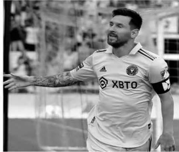
أكد نجم الأرجنتين ليونيل ميسي، المحترف في صفوف نادي إنتر ميامي الأمريكي، أنه لا توجد أي فرصة مطلقا لانتقاله على سبيل الإعارة إلى أي فريق خلال فترة الانتقالات

الشتوية المقبلة. وارتبط اسم «ليو» بالعودة إلى فريقه السابق برشلونة أو الانتقال إلى الملاعب السعودية، وخاصة إلى الهلال، بعد فشل إنتر ميامي، في التأهل إلى التصفيات النهائية للمنافسة على لقب الدوري الأمريكي. وبعد نهاية مباريات إنتر ميامي في الدوري الأمريكي لهذا الموسم نهاية الشهر الماضي، سيغيب الفريق فترة فراغ لمدة أسابيع لا تتخللها أي مباريات رسمية حتى فبراير المقبل عندما يبدأ الموسم الجديد من الدوري الأمريكي، وهو ما فتح الباب أمام التكهنات بشأن إمكانية انتقال ميسي إلى أحد الأندية الرابطة في ضمه على سبيل الإعارة. ولكن نجم الأرجنتين ألقى في تصريحات لصحيفة «ليكيوب» الفرنسية، الساب أمام الانتقال إلى برشلونة أو إلى أي فريق آخر خلال الميركاتو الشتوي القادم. وفي مقابلة مع «ليكيوب»، تلقى ميسي سؤالاً بشأن عما إذا كانت هناك فرصة لانتقاله الآن على سبيل الإعارة إلى برشلونة أو إلى أي فريق آخر فرد «البرغوث» قائلا: «لا، لا، لا، لا توجد فرصة. لا على الإطلاق». وكان ميسي، توج مؤخرا بجائزة الكرة الذهبية للمرة الثامنة في مسيرته، كأفضل لاعبي العالم خلال عام 2023، والمقدمة من «فرانس فوتبول»، نظرا لنوره الكبير في فوز منتخب الأرجنتين بلقب كأس العالم في قطر نهاية العام الماضي.