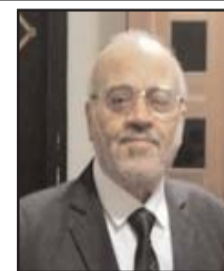
■ بقلم: عادل أبو هاشم

ليظهروا للعالم بأنهم دواجن سلام! أمام نئاب إسرائيلية اغتصبت الإنسان والأرض والمقدسات الفلسطينية والإسلامية، وانتهكت الأعراض، ودنست المقدسات!! هذا الشعار المسخ الذي ابتدعه بعض المنهزمين في أمتنا العربية، وصدقه كل العرب وتمسكوا به حتى آخر فلسطيني!! والعالم الغربي يمارس مؤامرة الصمت والاستهتار واللامبالاة ضد الشعب الفلسطيني! فعلى مدى قرن من الزمان نزف الفلسطينيون من الدماء ما لم يفرزه شعب من الشعوب، وخلال هذه الرحلة الطويلة بين الفلسطيني والدم، ورغم شلال الدماء الذي سال على أرض فلسطين الذي اختلط بترابها لينبت شقائق النعمان المتمثلة في شهدائنا البررة، فإن عدونا الأزلي والأبدي لا زال مصرًا على اإبادة كل ما هو فلسطيني في ظل صمت عربي أين منه صمت القبور! وأمام عالم منافع لا يحترم إلا القوي وإن كان مجرمًا وقاتلاً!! ولا يعترف بالأخلاق والحقوق، يقف مع الجلاذ ضد الضحية ليشرك في ذبحها! وصمت العالم المتحضر - كعادته - عندما يكون الدم المراق فلسطينيًا!! ولأنه شلال الدم الفلسطيني المتواصل منذ عشرات السنين فعلى العالم أن يلتزم الصمت!! ونتساءل بمرارة: هل يجرؤ أحد في الكيان الصهيوني على الإقدام على جرائمهم