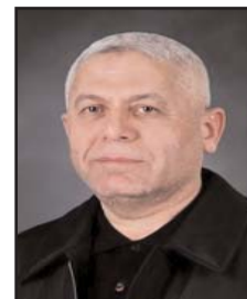
■ بقلم: رأفت مرّة ×

وتواطؤ عربي، حشد عسكري ضخم تجاوز 350 ألف جندي والاف الآليات، اصرار الاحتلال على استعادة هيبته وصورته، ظروف دولية غير مواتية لحماس، يفتح الباب لنجاة نتنياهو والفريق الحاكم، وهو فرصة لاستغلال التدمير المنهج للقطاع للقضاء على حماس.