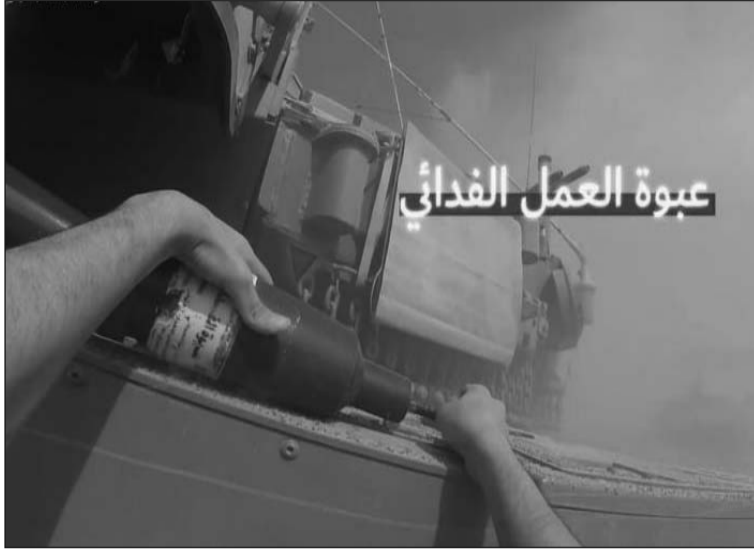
عبوة العمل الفدائي

الأفناق وأثرها إلى اللحظة. فقد بلغت خسائر إسرائيل من دبابات الميركافا حتى الآن 15 دبابة، تدمرت منها أربع بالكامل، ووقعت 10 في قبضة المقاومة، وألحق الضرر بواحدة، علاوة على العشرات من ناقلات الجنود.