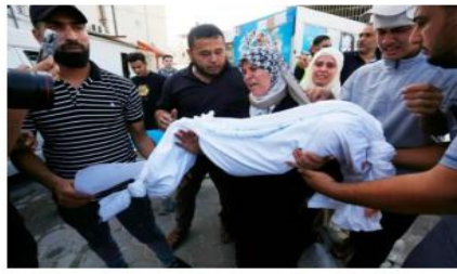
استشهد 3 فلسطينيين وأصيب ووقعت غارة على منطقة تل أحرور بلستهداف منزل في الزعر شمال القطوع.