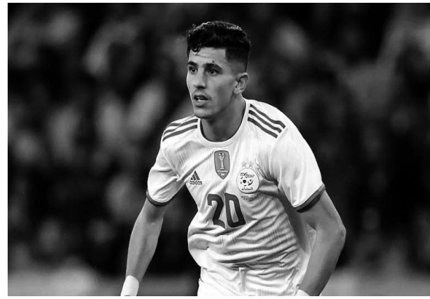
منذ الفتح من الشهر الماضي. بلماضي مدرب "الخضر" ووفقا لتقارير اعلامية، فإن يتمسك بتواجد عطل في