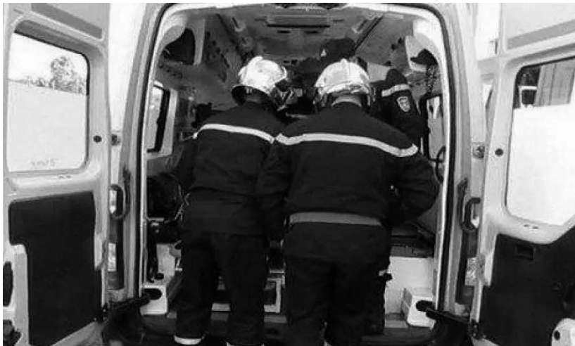
بولاية سطيف. ومن جهة أخرى، تدخلت الحماية المدنية من أجل إطفاء 41 حريق من الغطاء النباتي، منها 19 حرائق الغابات، بعدة ولايات.

كما تدخلت الحماية المدنية بـ يضيف نفس البيان من أجل تقديم الإسعافات الأولية لـ 8 أشخاص مختنقين جراء استنشاقهم لغاز أحادي أكسيد الكربون ببلدية بوقاعة