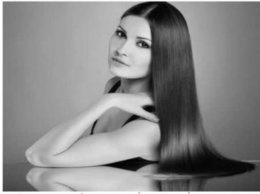
عدم الإفراط في غسل الشعر

قد يظن البعض أن كثرة غسل الشعر أمر جيد، حيث يساعد على التخلص من العرق، الدهون الزائدة والأتربة العالقة. لكن هذا أمر خاطئ، فحتى بالنسبة للشعر الدهني، لا ينبغي غسله لأكثر من 3-4 مرات خلال الأسبوع، أما في حالة الشعر الجاف، فتكفي مرتين فقط. هذا لأن كثرة غسله يزيل الزيوت الطبيعية اللازمة للشعر.