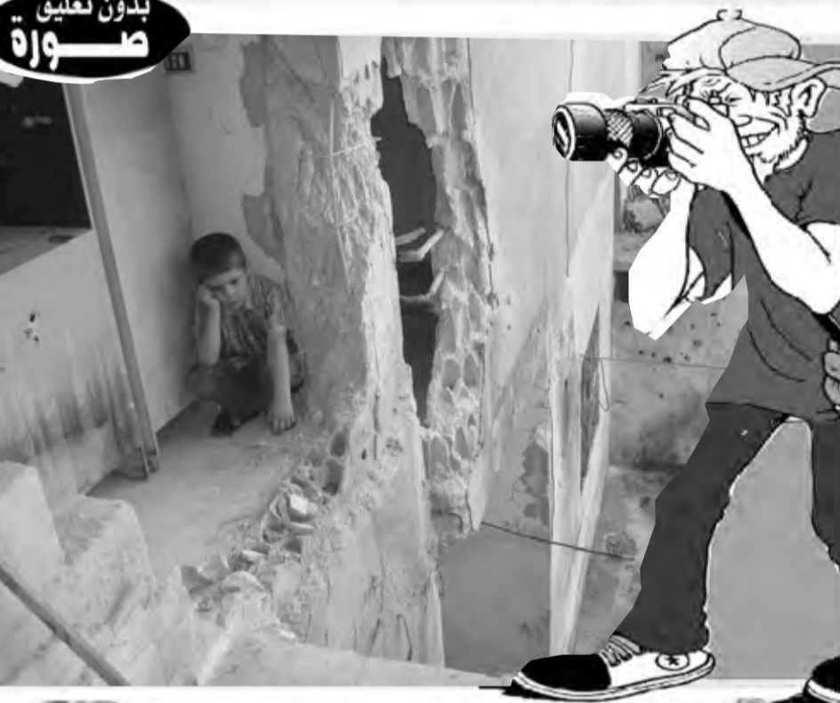
بدون تعليق صورة

تجدر الإشارة إلى أن استهداف الجيش الصهيوني للصحفيين لم يقتصر على قطاع غزة وإنما شمل مجموعة من الصحفيين في بلدة عملا الشعب جنوبي لبنان في 13 من أكتوبر، وهو ما أسفر عن مقتل صحفي وإصابة 3 آخرين، هذا، ودخلت الحرب يومها الـ 29 منذ بدء عملية "طوفان الأقصى" حيث يواصل الجيش الصهيوني قصف قطاع غزة في ظل مخاوف دولية من اتساع رقعة النزاع في الشرق الأوسط، وبلغت حصيلة ضحايا القصف الصهيوني على قطاع غزة منذ 7 أكتوبر 9227 قتيلًا من بينهم 3826 طفلًا بالإضافة إلى 23516 مصاب، وعلى الجانب الصهيوني قتل أكثر من 1400 شخص بينهم مئات العسكريين، علما أن "حماس" أسرت أكثر من 240 صهيوني.