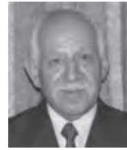
بقلم المحامي، إبراهيم شعبان