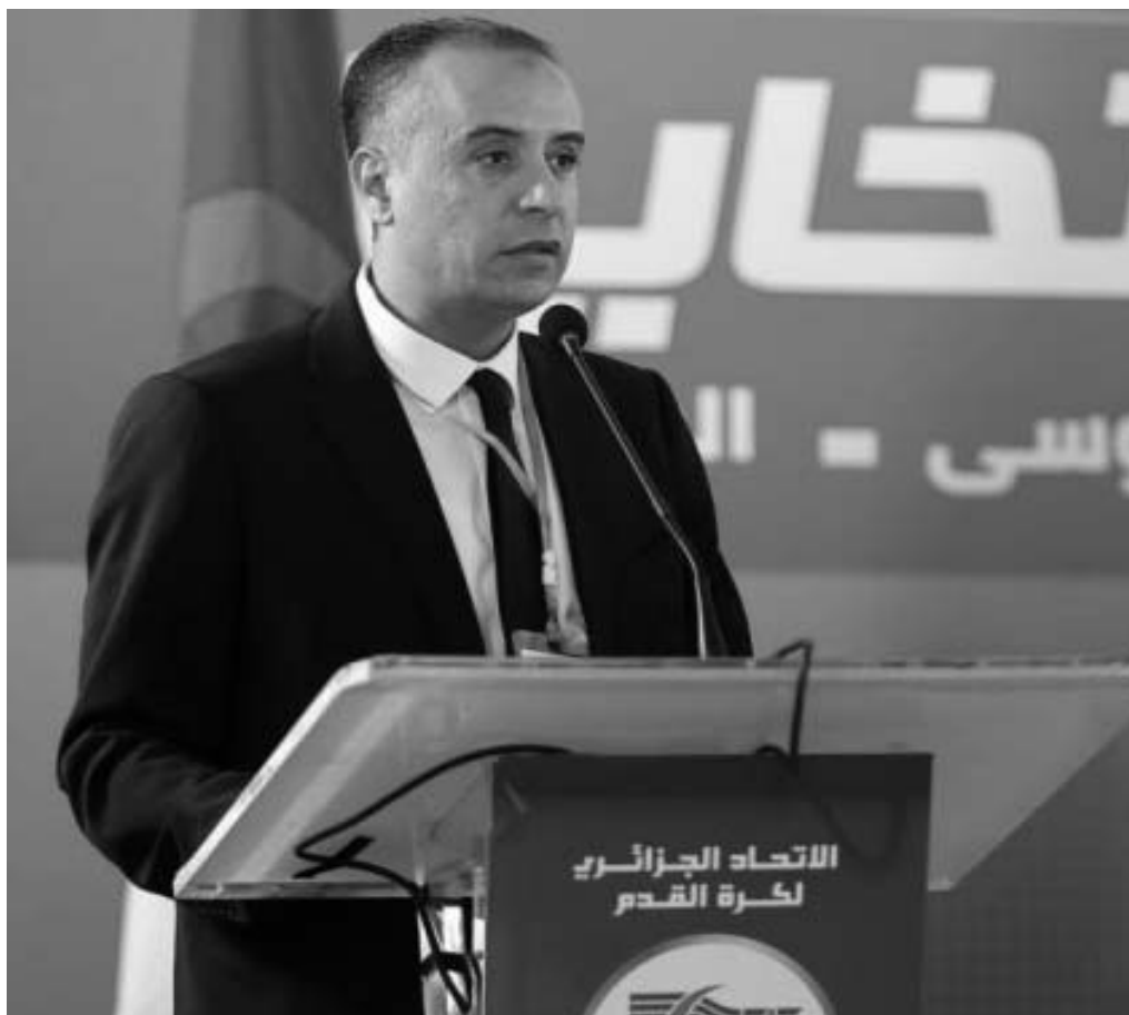
وسيلعب "الخضر" في المجموعة مبارياتها، وتضم إلى جانب الجزائر وأنغولا. والرابعة التي تحتضن مدينة "بواكي" كلاً من بوركينا فاسو، موريتانيا