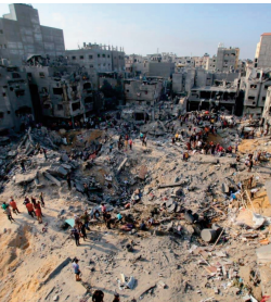
وكان صباح يوم 14 أكتوبر، تعرضت مدرسة "الفاخرة" في مخيم جباليا، الواقعة في حي "الأمجد"، للقصف الإسرائيلي، مما أسفر عن مقتل 400 فلسطيني، وفق جلاء الاستهداف الصهيوني، لمرسة "الفاخرة" في مخيم جباليا، بعد مقتل 100 فلسطيني في قصف سابق.

استشهد عشرات الفلسطينيين وأصيب آخرون في قصف صهيوني يوم السبت مدرسة "الفاخرة" التي تأسسها منظمة التحرير الفلسطينية في مخيم جباليا، وذلك في إطار سلسلة من الهجمات التي تستهدف المدنيين في قطاع غزة منذ بدء العدوان الإسرائيلي على غزة في 7 أكتوبر 2023.