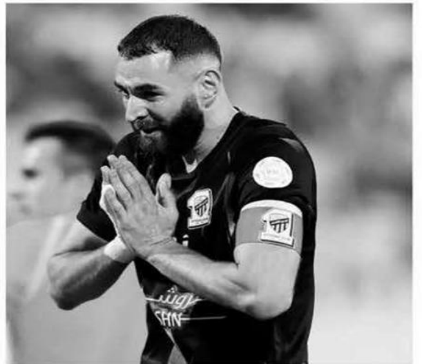
يستعد نادي الاتحاد السعودي، لمواجهة حاسمة أمام القوة الجوية العراقي، الاثنين القادم، ضمن منافسات الجولة الرابعة من مسابقة دوري أبطال آسيا 2023-2024 لكرة القدم.

ومنذ انطلاق الموسم الحالي، شارك بنزيما بقميص الاتحاد في 10 مباريات، أحرز خلالها 6 أهداف وصنع 3.