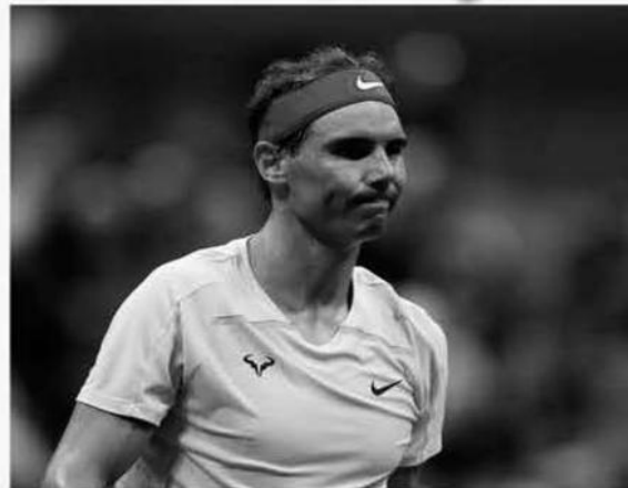
بواصل نجم كرة المضرب، الإسباني رافاييل نادال الغياب عن المباريات في العام الحالي 2023 الذي يعتبر من أسوأ الأعوام في مسيرته، وذلك بسبب الإصابة.

الإصابة وكشف توني نادال، عن اللاعب ومدربه السابق لسنوات طويلة، في تصريحات الجمعة، لصحيفة "ماركا" الإسبانية، أن اللاعب سيكون جاهزا للمشاركة في بطولة أستراليا المفتوحة للتنس التي ستدور بداية العام المقبل 2024، وتحديدا في 16 يناير/كانون الثاني بملبورن بارك. وقال توني: "أحاول إيهن أخي أن يكون حذرا، وهذا ما يجب عليه فعله، لكنني أعتقد أنه في بطولة أستراليا المفتوحة، يجب أن يكون رافا قادرا على اللعب بشكل طبيعي لأنني وأبيه يتدرب، يتحسن كل يوم قليلا، لقد تلقى إصابة أجبرته على راحة مطولة لكنه سيكون جاهزا قريبا". وتحدث نادال عن حظوظ ابن أخيه في البطولة بعد عودته: "إنه يدرك أن الوضع معقد، لنفرض أنه تمكن من الوصول إلى أستراليا، فلن يكون من السهل المنافسة مرة أخرى مع وجود مشكلة إضافية، وهي أنه غير مصنف في الوقت الحالي، حيث ستضعه القرعة في مواجهة أحد اللاعبين المتقدمين في الترتيب، لننتظر".