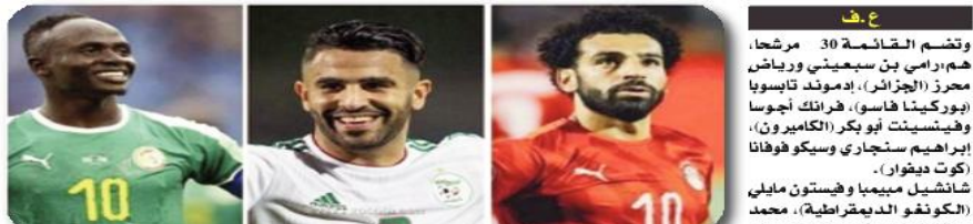
ع.ف. وتضم القائمة 30 مرشحاً، هم رامى بن سبيني ورياض محرز (الجزائر)، إدموند تابوسيا (بوركينافاسو)، هرانك أوجوسا وفيسينيت أبو بكر (الكاميرون)، إبراهيم سنجاري وسيكو هوفانا (كوت ديفوار)، شانيل ميمبا وفستون مابلي (الكونغو الديمقراطية)، محمد صلاح ومحمود كهرابا ومحمد عبد المنعم ومحمد الشناوي (مصر)، محمد قدوس وتوماس بارثي (غانا)، سيرجو جيري (غينيا)، نغيس بيسوما (مالي)، أشرف

بن سبيني ضمن قائمة اللاعبين المرشحين للقب صلاح وماني ومحرز.. صراع متجدد على جائزة الأفضل بأفريقيا أعلن الاتحاد الأفريقي لكرة القدم (كاف) الأرياء قائمة اللاعبين المرشحين للقب أفضل لاعب أفريقي لعام 2023.