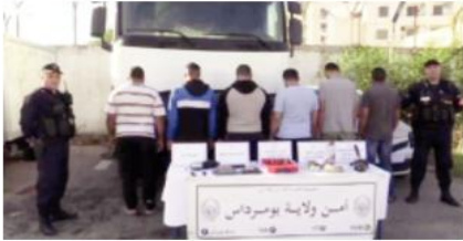
ب.ر. جاء في البيان، "تكتلت فرقة مكافحة الجرائم الكبرى بالصلحة الولائية للشرطة القضائية بأمن ولاية بومرداس، من تفكيك نشاط شبكة إجرامية تقوم بالتزوير في الملفات القاعدية للمركبات، القضية تمت بعد اكتشاف عناصر الفرقة لرقم تسلسلي في طراز إحدى المركبات تظهر عليه آثار التزوير، ليتم تحويلها وفتح تحقيق في القضية".

خشبية وثلاثة أوراق زجاجية تستعمل في مسح آثار آلة قطع الحديد في مكان التزوير. هذه الوسائل تستعمل في تغيير أرقام لوحات ترقيم المركبات وكذا هياكل المركبات. تم إجازة ملفات قضائية ضد المشتبه فيهم وتقديمهم أمام العدالة عن تهمة تكوين جمعية أشرف قصد الإعداد الإجرامية للتزوير واستعمال المزور في محرمات إدارية ورسمية. وضع لسير مركبة بلوحة ترقيم من شأنها أن توهم بأن المركبة تم تزويرها بصفحة قانونية بالتراب الوطني، وفق ذات البيان.