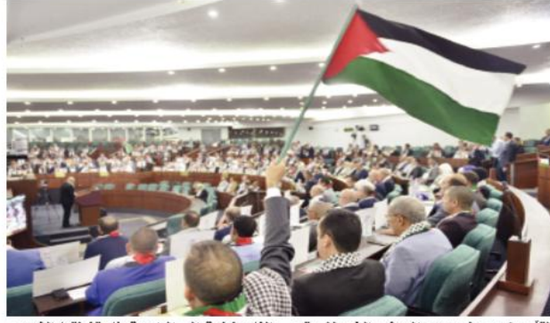
التأميرين وحطم وهم الجيش الذي لا يقهر الفلسطينية إلى الواجهة فاحتضنتها الشعوب الحرة في جميع بقاع العالم. منوهين بـ"المقاومة

وبطولاتها في الدفاع عن الامة وقيمها". وفي المقابل أعربوا عن "استنكارهم لسياسة الكيل بمكيالين التي يمارسها الاعلام الغربي لتجاه الانتهاكات الواضحة في حق المدنيين الفلسطينيين". مؤكداً "حق الشعب الفلسطيني في الدفاع عن أرضه ومقدساته بكل الوسائل والطرق". وبالمناسبة، دعا نواب المجلس، البرلمان والنخب والشعوب عبر العالم إلى "الضغط من أجل وقف العدوان وفتح المايير، وتشكيل لجنة دولية للتحقيق في جرائم الاحتلال لإحالة مجرمي الحرب الصهاينة إلى محكمة الجنايات الدولية". ويعد أن حمل النواب مجلس الأمن الدولي مسؤولية استمرار الجازر والحرق في غزة، ثموا الموقف المشرفة للشعب الجزائري وتخذلها في صف الحق والعدل والدفاع عن قيم الانسانية". للإشارة، فإن الجلسة الاستثنائية، انعقدت بطلب من المجموعات البرلمانية للمجلس الشعبي الوطني.