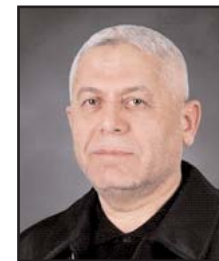
■ بقلم: رافات مرا

تطرف بايدن إلى أبعد حدود، ووصل إلى تل ابيب معتبرا ان المعركة معركة، ثم ارسل قوات عسكرية ضخمة إلى المنطقة للضغط على حماس والدول العربية واي دولة تفكر في معارضة الموقف الامريكي. دخول الإدارة الأمريكية بهذا المستوى والعمق من الدعم اللامحدود لحكومة نتياهو وفر غطاء للجرائم الإسرائيلية