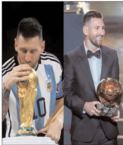
أسطورة ألمانيا ينتقد فوز ميسي

رجح التائق في كأس العالم الأخير، الذي استضافته دولة قطر في 2022، كفة النجوم الذين قدموا بصمتهم فيه، على مستوى جائزة الأفضل في العالم (الكرة الذهبية)، وسباق جائزة أفضل لاعب في قارة آسيا.