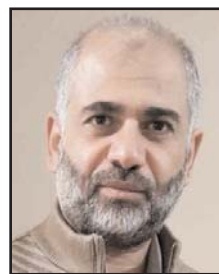
■ بقلم: د. مصطفى يوسف اللدوي

أجزم أن عشرات آلاف الفلسطينيين من سكان قطاع غزة، ومنهم أنا وزوجتي وبناتي، الذين يعيشون في المنافي والشتات، وفي دول الخليج العربية والسعودية، وفي مصر ودول أوروبا ودول القارتين الأمريكيتين، وفي مخيمات اللجوء في سوريا والأردن ولبنان، وفي تركيا التي يقيم فيها آلاف الغزيون الذين لجأوا إليها في السنوات الأخيرة، طلباً للرزق وسعيًا للعمل أو محاولة للهجرة، وجُل هؤلاء لهم أهلٌ وعوائلٌ وأسرةٌ في قطاع غزة، وبعضهم يعيش في الشتات وحده طلباً للعلم أو سعيًا للرزق، تاركاً أولاده وحدهم في غزة، أو في كنف أسرهم وعائلاتهم.