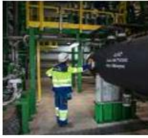
أكسيد الكربون قدر المستطاع