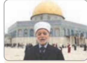
ثمن مفتي القدس والديار الفلسطينية، الشيخ محمد أحمد محمد حسين، "موقف الجزائر" الثابت والأصيل في دعم القضية الفلسطينية

ومساندة شعبها في كفاحه من أجل الحرية والاستقلال. وتقدم الشيخ محمد حسين في تصريح للإذاعة الوطنية، بث أمس الاثنين، بالشكر لرئيس الجمهورية، عبد المجيد تبون، وللشعب الجزائري بكل أطيافه على "الموقف الأصيل والثابت في دعم الشعب الفلسطيني وقضيته منذ بدايتها"، مؤكداً أن "الجزائر قيادة وشعبا تشاركنا الأمل في الحرية والاستقلال الذي ينظر ويتطلع له أهلتنا في فلسطين والذي سيتحقق في المستقبل العاجل، بإذن الله".