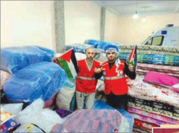
حملات "شتاء دافئ" سترافق حملات المساعدة غزة

أغرق الجزائريون الجمعيات والهيئات الخيرية والإنسانية بالمساعدات والتبرعات، ولم يتوقف أغلبهم عن الاستفسار حول كيفية تقديم المال والدعم، وحتى فتح بيوتهم لاستقبال ضحايا الحرب الذين أصبحوا دون مأوى في غزة الجريحة.. هذا ما أكدته ممثلون للمجتمع المدني الذين حضروا لقاء مع رئيسة الهلال الأحمر الجزائري، وهم قلقون يبحثون عن حلول ولآليات واقتراحات من الهلال الأحمر لتخزين التبرعات العينية المتمثلة في الدواء والمواد الغذائية والأفرشة، وإيصالها إلى سكان غزة.