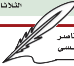
عبد الناصر بن عيسى

من التطبيع مع دول عربية مترامية في قلب الخليج وفي المحيط، لكن ما زرعت من دمار وجبروت، ستحصده قريبا بنهاية مأساوية ستنتسف كيانها، فلا طاغية ولا ظالم خلد في التاريخ. خلال الحروب العربية الكلاسيكية من نكبة 1948 إلى العبور 1973، ومرورا بالعدوان الثلاثي على مصر 1956 ونكسة 1967 وحرب الاستنزاف، كان الطرف المدافع على الحق عربيا بالكامل، وكانت تركيا غارقة في علمانياتها وتوؤدها للغرب بما في ذلك أمريكا وإسرائيل، وكانت إيران تحت سيطرة شاه لا يرى إلا ما تراه أمريكا وطبعا إسرائيل، ولكن الأمور تغيرت في حروب المقاومة في السنوات الأخيرة، وعلمت إسرائيل، بأنها محاطة بشعوب وقياد تكمن لها العدا، وتنتظر ببارغ الصبر اليوم الذي تمسحها من خارطة الشرق الأوسط، وطال الزمن أم قصر، فستدفع فاتورة مظالمها كاملة من دون نقصان، وكما بدأ الإسلام غربيا فسيعود غربيا كما بدأ، فطوبى للغرباء.