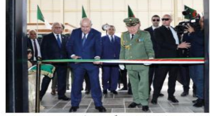
«تدشين خط السكك الحديدية بوغزول (المدية)-الجلفة-الأغواط»

أشرف رئيس الجمهورية، عبد المجيد تبون، يوم أمس الأحد، على تدشين ومعاينة عدد من المشاريع التنموية الهامة، خلال زيارة عمل وتفقد إلى ولاية الجلفة، كما خص الرئيس تبون خلال هذه الزيارة باستقبال شعبي كبير من قبل مواطني الولاية، الذين أكدوا انخراطهم في مسمى بناء الجزائر الجديدة.