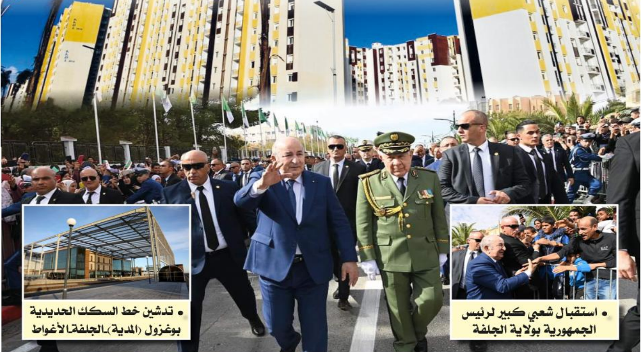
• تدشين خط السكك الحديدية بوعزول (المدية) - الجلفة - الأغواط