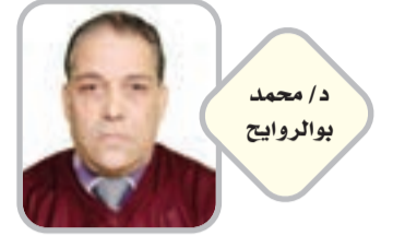
د / محمد بوروايج

قد يبدو الحديث عن الفكر الاستشرافي في كتب مالك بن نبي فكرة افتراضية أو فضاضة أو غير واقعية، لأن العصر الذي عاش فيه مالك بن نبي كان امتدادا نسبيا للعصر الكلاسيكي الذي بدأ يتعامل مع منتجات الحداثة والتكنولوجيا بطريقة محدودة ومحتشمة. في فكر مالك بن نبي رؤى استشرافية كثيرة تنبئنا إذا نحن أمعنا النظر في كتبه عن كثير من معالم العالم المستقبلي الذي كان يدور في مخيلة مالك بن نبي من قراءاته وتحليلاته العميقة للفكر الحضاري وللمشكلات والتحديات المرتبطة به. لقد وظف مالك بن نبي خلفيته الهندسية لاستشراف مسارات الفكر الإنساني وتطوره مع مرور الزمن، وهذا ما جعله يبدع وبطريقة غير مسبوقه في وضع تصور هندسي للعالم في المراحل اللاحقة أو مرحلة ما يسمى بالعالم الرقمي.