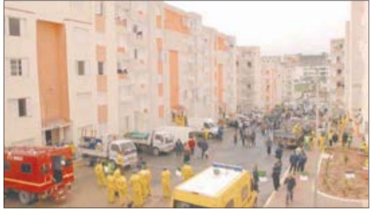
سيد أحمد فلاحي

المواطنين، وتقضي على كل أشكال الفوضى والبداهة التي عشت طويلا.