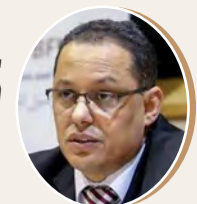
بقلم: خالد حاجي ص 8

لك الله يا غزة الأبية في ليلة السبت الدموية