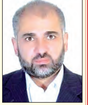
بقلم د. مصطفى يوسف اللداوي

ولا وقود ولا سيارات مدنية، ولا وقف للقصف ولا مناطق آمنة، لكنهم صبروا واحتملوا، وإن بكت عيونهم فقد عضوا على الجرح وكنتموا الأهه وأخفوا الحزن، وقاموا بوسائلهم البسيطة، وأيديهم العارية، وأجسادهم الضعيفة التي اعترها التحول بعد حصار الجوع والعطش والحرمان من الدواء والكهرباء، بدفن شهدائهم وإن لم يعرفوا هوياتهم ويميزوا عائلاتهم، ونقلوا إلى المستشفيات جرحاهم حملا على الأكتاف أو جراً على العربات، وهم يعلمون أن الكثير منهم سيلحق، إذ لا يوجد في المستشفيات ما ينفع، ولا يتوفر فيها ما يعالج جرحاً أو يخفف ألماً.