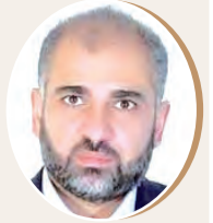
بقلم: مصطفى يوسف اللداوي ص 9

لك الله يا غزة الأبية في ليلة السبت الدموية