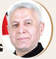
بقلم: رافت مرة ص 9

سلوك بايدن وإدارته عقد الأزمة وصعب الحلول!