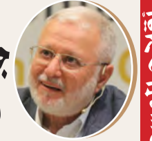
بقلم: محسن صالح ص 8