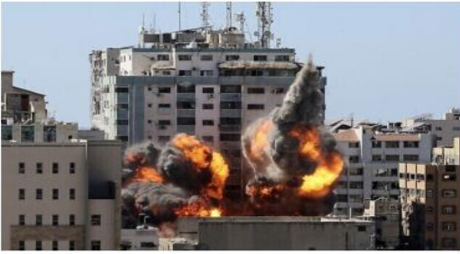
هاستينغز، منسقة الشؤون الإنسانية وأنشطة المستشفيات «لا يمكن أن في «أوتشا»، إن العمليات الإنسانية تستمر بلا اتصالات».