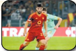
النجم الجزائري، هشام عوار، الظهور بشكل أساسي في مباريات روما الأخيرة، مثلما كان الحال

في لقاء دوري المجموعات من مسابقة الدوري الأوروبي أمام سلافيا براغ التشيكي، الخميس الماضي، وانتهى بفوز الفريق الإيطالي بهدفين دون مقابل على ملعب "أولمبيكو". ونقل موقع "فوتبول إيطالي"، تصريحات لعوار يتحدث فيها عن الأداء الذي قدمه منذ انتقاله إلى الكالتشيو، خصوصًا بعد الانتقادات التي تعرض لها قبل أيام من قبل مدربه في روما البرتغالي جوزيه مورينيو، مشددًا على أهمية لقاء القمة أمام إنتر ميلانو المقرر الأحد المقبل، ضمن منافسات الدوري الإيطالي لكرة القدم.