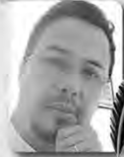
بقلم : حسان زهار

الأحد 28 أكتوبر 2023 الموافق لـ 13 ربيع الثاني 1445 هـ