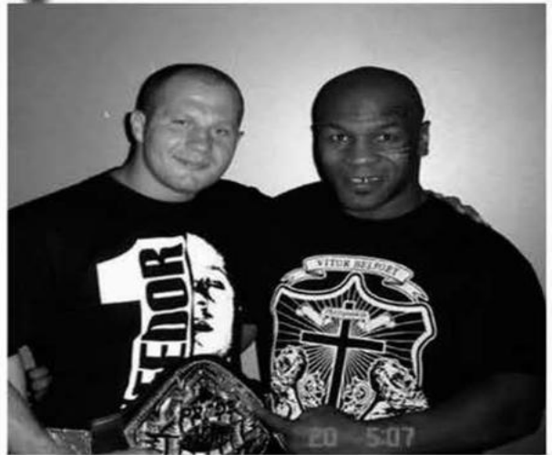
أوضح بطل العالم السابق في الملاكمة للوزن الثقيل مايك تايسون السبب وراء رفضه النزال أمام مقاتل الفنون القتالية المختلطة الروسي فينور إميليانينكو.

وأثار النزال المحتمل بين تايسون وإميليانينكو اهتمام عشاق الرياضات القتالية والملاكمة لسنوات. وقبل النزال التاريخي المنتظر، والذي يجمع بطل الملاكمة للوزن الثقيل البريطاني تايسون فيوري، والكابروني- الفرنسي فرانسيس نغافو البطل السابق لـ«بطولة القتال النهائي» UFC في مواجهة تحت مسمى «منزلة الأشرس»، وذلك عدا السبت أكتوبر الجاري ضمن فعاليات موسم الرياض 2023 بنسخته الرابعة. وتم طرح سؤال على بطل الملاكمة السابق تايسون قبل المؤتمر الصحفي الخاص بالنزال في الرياض. وقال الملاكم البالغ 57 عاماً إنه لن يكون هناك نزال وفقاً لقواعد الملاكمة ضد إميليانينكو البالغ 47 عاماً، والسبب أن «الروسي هو مثلي الأعلى». في 5 فبراير، خسر فينور إميليانينكو أمام الأمريكي راين بستر بالضربة القاضية في الجولة الأولى. وجرى النزال ضمن بطولة Bellator وكان النزال بمثابة وداع للأسطورة الروسية في قسم الوزن الثقيل. فيما كانت لخر مرة دخل فيها تايسون المحلية ضد مواطنه روي جونز عام 2020. وانتهى النزال وقتها بالتعادل، وكان هذا الأداء هو الأول لتايسون منذ 15 عاماً، ففي عام 2005، هزمه كيفن ماكيرايد.