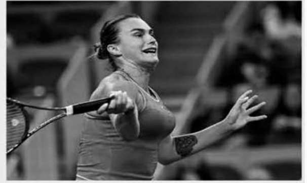
تتعلق يوم 29 أكتوبر/ تشرين الأول الحالي، نهائيات الجولة الختامية للاعبات التنس المحترفات، التي ستحتضنها المكسيك لهذا الموسم، لكن يبدو أن الأمور التنظيمية لا

تسبب على أحسن وجه، قبل أيام قليلة من انطلاق المسابقة. ووجهت النجمة البيلاروسية أرينا سابالينكا المصنفة أولى عالمياً، اليوم الخميس، من خلال خاصية «ستوري»، على حسابها في «إنستغرام»، انتقادات واسعة للمشرفين على تنظيم البطولة. واستغربت اللاعب في تعليقها الذي أرفقته بمقطع فيديو نشرته من ملاعب التدرجات، وجود ملعبين فقط لإحتضان التدريب، وذلك حتى يوم السبت، أي قبل يوم واحد من انطلاق البطولة. وتشارك في هذه المسابقة، أفضل 8 لاعبات في التصنيف العالمي للاعبات التنس المحترفات، ومن بينهن اللاعبة التونسية أنس جابر، وهو ما كان يفرض وجود أكثر من ملعبين فقط، خصوصاً وأن هذه البطولة تعتبر من أهم البطولات في موسم التنس، ومن أكثر البطولات أيضاً التي تحوّل اللاعبة المتوجة المحصول على عدد كبير من النقاط، وهو ما يعني إمكان حدوث تغييرات في الترتيب العالمي.