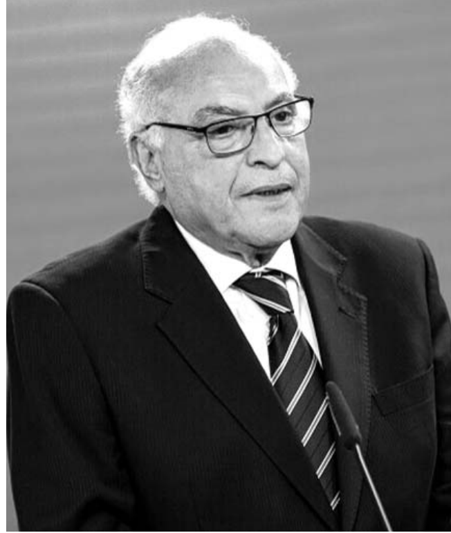
■ محمد ج

شدد وزير الشؤون الخارجية والجمالية الوطنية بالخارج، أحمد عطف، الخميس بنويورك، على أن التعامل مع التطورات الخطيرة في الأراضي الفلسطينية المحتلة، يجب أن يفضي إلى تحرك جماعي تتخرط فيه جميع الأطراف الدولية الفاعلة والمؤثرة لبناء سلام دائم عادل ومستدام في الشرق الأوسط على أسس المراجع التي أقرتها الشرعية الدولية، مجددا دعوة الجزائر لمنح العضوية الكاملة لدولة فلسطين الشقيقة بمنظمة الأمم المتحدة.