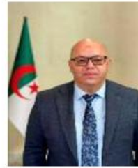
لرئيس الجمهورية، السيد عبد المجيد تبون.