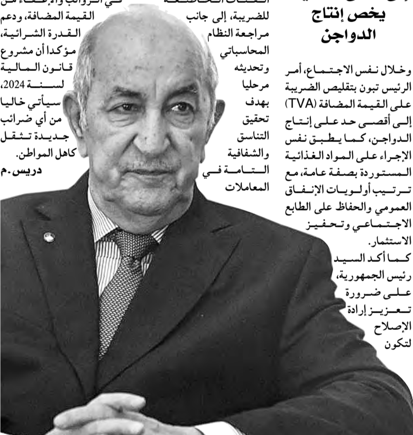
حشيشي يبرز الدور المحور للمجمع في ضمان التموين الأمن إلى إسبانيا

وخلال نفس الاجتماع، أمر الرئيس تبون بتقليص الضريبة على القيمة المضافة (TVA) إلى أقصى حد على إنتاج الدواجن، كما يطبق نفس الإجراء على المواد الغذائية المستوردة بصفة عامة، مع ترتيب أولويات الإنفاق العمومي والحفاظ على الطابع الاجتماعي وتحفيز الاستثمار. كما أكد السيد رئيس الجمهورية، على ضرورة تعزيز إرادة الإصلاح لتكون