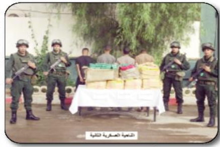
الضلع العسكري الثاني

تمكنت مطارز لجيش الوطني الشعبي، خلال عمليات متفرقة عبر التراب الوطني في الفترة الممتدة من 18 إلى 24 أكتوبر 2023، من توقيف 9 عناصر دعم للجماعات الإرهابية، حسب ما أوردته الأريعاء حصيلة لوزارة الدفاع الوطني.