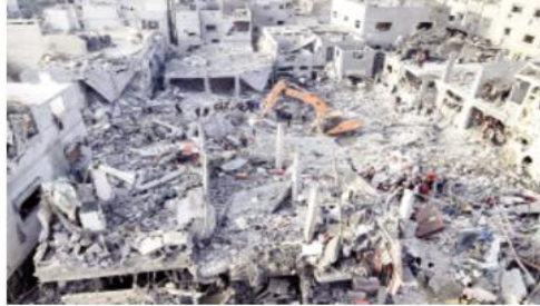
كاهياً لمكافحة الفقر.

وأشارت إلى أنه جرى تقييم المواقف المتخذة دولياً وقليمياً، وما يجب على أطراف محور المقاومة القيام به في هذه المرحلة الحساسة لتحقيق انتصار حقيقي للمقاومة في غزة وفلسطين، ووقف العدوان الغادر والوحشي على شعبنا المظلوم والصامد في غزة وفي الضفة الغربية.. ولفتت الوكالة إلى أنه جرى الاتفاق على مواصلة التنسيق والمتابعة الدائمة للتطورات بشكل يومي وفعال، وتشهد المناطق الحدودية في جنوب لبنان توتراً أمنياً وتبادلاً لإطلاق النار بين الجيش الإسرائيلي وعناصر تابعة لحزب الله، في جنوب لبنان.