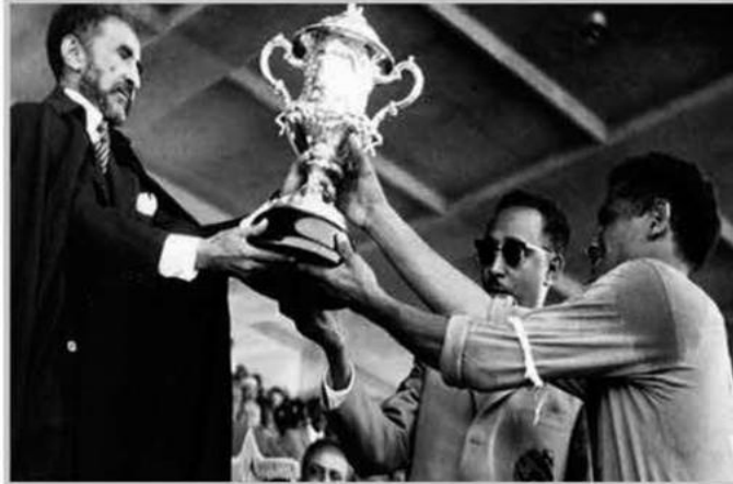
الإثيوبي خرج منتصرا، حيث تغلب أولا على تونس ثم هزم مصر بعد الوقت الإضافي في المباراة النهائية.

فازت ست دول مختلفة بالألقاب من 1970 إلى 1980: السودان، الكونغو، زانير، المغرب، غانا ونيجيريا. جاء لقب زانير الثاني في نسخة 1974 (فازت بأول لقب لها باسم جمهورية الكونغو الديمقراطية) بعد مواجهة زامبيا في النهائي. للمرة الوحيدة حتى الآن في تاريخ المسابقة، كان لا بد من إعادة المباراة حيث انتهت المباراة الأولى بين الفريقين بالتعادل 2-2 بعد الوقت الإضافي. أعد تنظيم المباراة النهائية بعد يومين بفوز زانير 2-0. سجل المهاجم مولامبا ندياي جميع أهداف زانير الأربعة في هاتين المباراتين: كان أيضا أفضل هداف في البطولة برصيد تسعة أهداف، مسجلا رقما قياسيا في البطولة الواحدة لا مثيل له. قبل ثلاثة أشهر، أصبحت زانير أول دولة إفريقية إمن جنوب الصحراء تتأهل إلى كأس