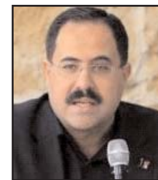
■ بقلم: صبري صيدم

وصمة عار على جبين الإنسانية وبذلك استمرت الحرب وحممها وتعظم القصف ليكون التاريخ شاهداً على الطفل الذي استلقى على الأرض إلى جانب شقيقه الغارق بالدماء طالباً منه ببرودة أعصاب أن ينطق الشهادة تمهيداً لاستشهاده، ولا ذلك الطفل الذي طلب منه