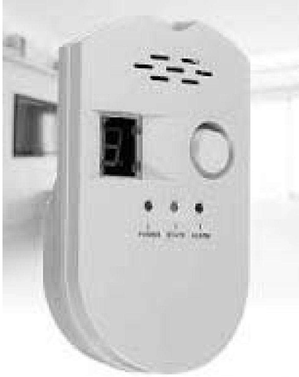
الهندسة العكسية في النظام البيئي التقني الوطني، قد جرى بحضور وزير الصناعة و الإنتاج الصيدلاني، علي عون، و وزير التكوين و التعليم المهنيين، ياسين ميراوي.