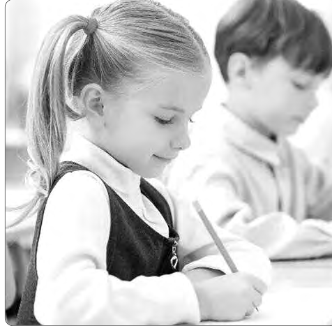
بعد يوم شاق من العمل..

ويختص المختص في علم النفس التربوي، بالتأكد على أن الأم تبقى أول معلم محترف للتكفل بالعملية التعليمية، كونها الأقرب والأصدق والأقدر على تحمل هذه المسؤولية، مشيرا إلى أن الثقة التي يضعها الآباء في الأمهات، جعلتهم يلقون هذه المسؤولية على عاتقهن، كونهن الأقرب إلى الأبناء، مردفا أن العملية التواصلية تتم بين الأمهات والأبناء أكثر من الآباء، ولعل ما يرجع الكفة لصالح الأمهات أكثر من الآباء، ناصحا الأمهات بضرورة الاستعانة بالمستشارين والخبراء، لجعل ما تقدمه مفيدا لأبنائهن، وحتى لا يقعن في فخ الدروس الشخصية، ويتعلمن المنهجية الصحية لتعليم أبنائهن تعليما صحيا.